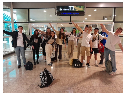
účastníci výpravy do Barcelony, foto: Norma Garcíová, Jakub Jelen